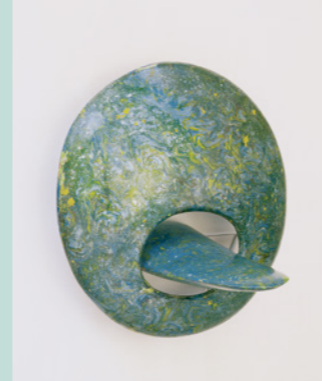
Lun Tichnowski Ohne Titel, 1994 Scagliola Durchmesser: 70 cm Sammlung Würth, Inv. 3297

After that, Tichnowski enriched the range of contemporary sculpture in the Würth Collection with works of his own and, as an exhibition architect and