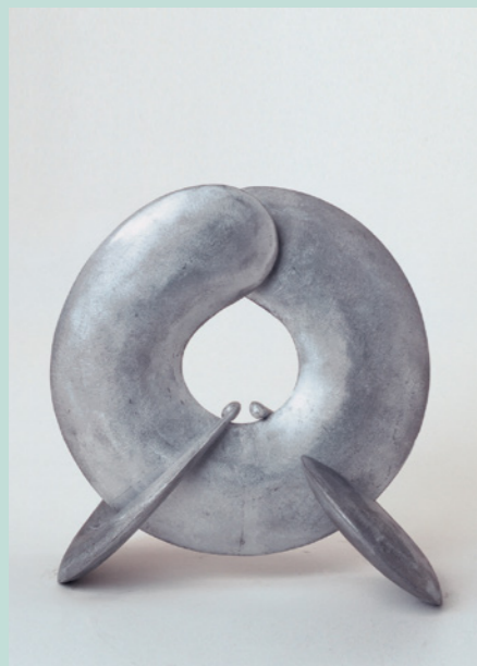
Lun Tichnowski Pi project, 2006 Aluminium 28 x 25 x 28 cm Sammlung Würth, Inv. 15192