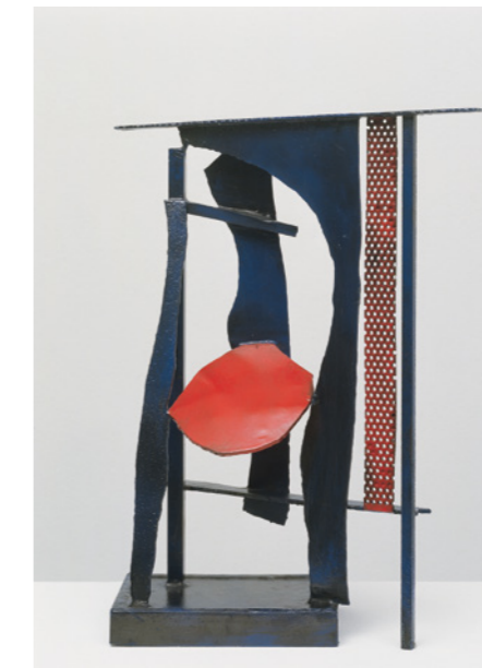
Robert Jacobsen Sladrebrojekt | Klatschmaulobjekt, 1991 Eisen, schwarz, rot und blau bemalt 38 x 29 x 12 cm Sammlung Würth, Inv. 3404