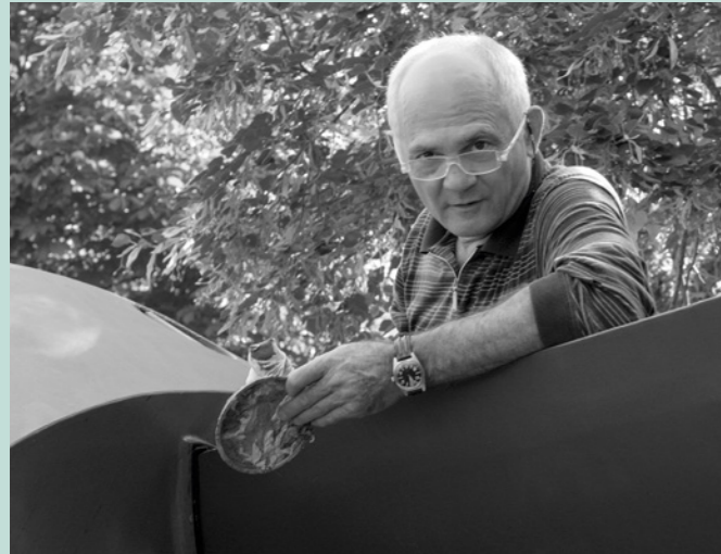
Lun Tuchnowski, 2004

Lun Tuchnowski (1946–2018) zählt zu den Künstlern, die zwei wesentliche bildhauerische Auffassungen des 20. Jahrhunderts miteinander verbanden: eine geometrische und eine organisch-figurative Formensprache. Mit spielerischer, oft humorvoller Leichtigkeit liess er diese Gegensätze aufeinandertreffen und «geradezu lustvoll das scheinbar Unvereinbare miteinander konkurrieren und dialogisieren» (Lothar Romain). Geschwungene Formen, die wie Fühler oder Tentakel in den Raum greifen, durchbrechen klare geometrische Konturen und