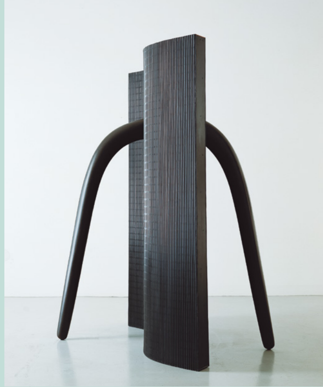
Lun Tichnowski Grosse Wand, 1994 Aluminium, Bronze 178 x 135 x 120 cm Sammlung Würth, Inv. 3774